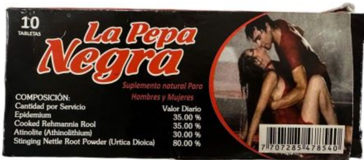
Fig.1: Imagen del producto LA PEPA NEGRA comprimidos.